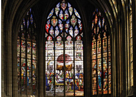
Vitrail de la Dormition