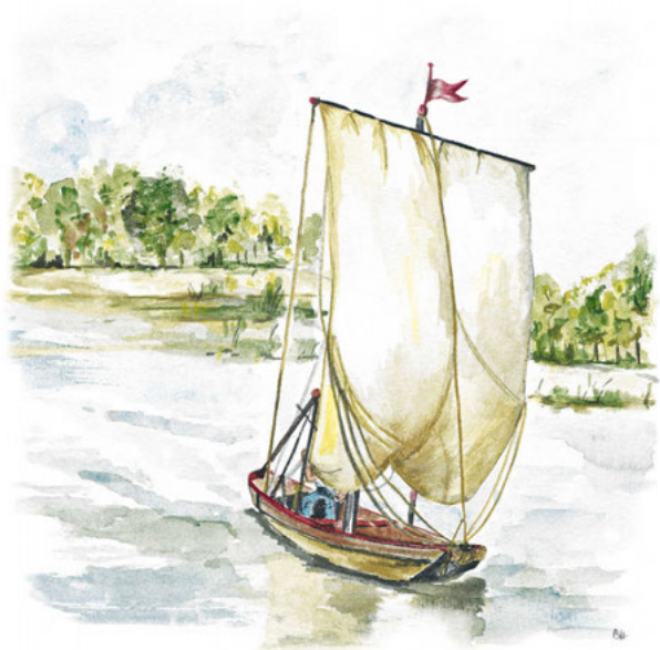
Gabare, aquarelle de Betty Houssais

jusqu'à la rivièrre et d'en découvrir les aspects pittoresques. Des maisons de marinièrs derrièrre le Sacré-Cœur à celles des propriètaires au bord de l'Allier, le quartier recèle ses codes, joyaux et traditions propres. Le groupe nivernais Rézonances ponctuera cette promenade de chants traditionnels de marinièrs pour une visite encore plus festive !