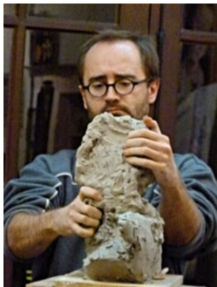
Atelier de modelage, Vincent Thivolle