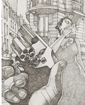
Hors-série Marianne, Polar, Miles Hyman, 2016