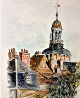
Jacquemart, aquarelle de Betty Houssais