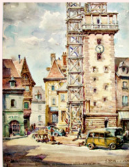
Restauration du Jacquemart incendié le 14 septembre 1946 Alexandre Veyre, aquarelle