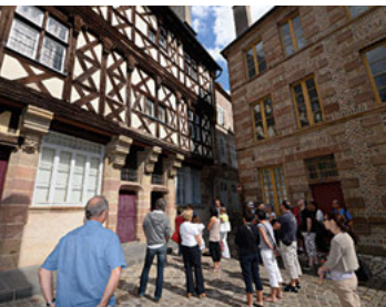
Quartier de l'ancien Palais