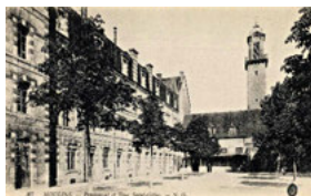
Pensionnat et tour Saint-Gilles

De la place d'Allier à celle de l'Ancien Palais en passant par la place Marx-Dormoy ou celle de l'Hôtel de Ville, retrouvez à travers l'histoire de ces aménagements l'histoire même de notre cité. Objets de toutes les attentions, les places bougent et se parent, se créent sur d'anciennes ruines ou conservent au cœur de la ville leur forme séculaire.