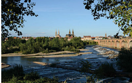
L'Allier en aval du pont Régemortes