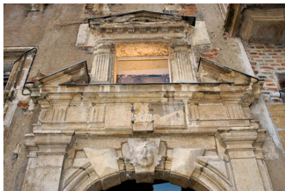
Moulins, Hôtel de Villaine, lairaie