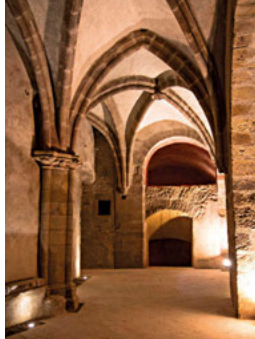
Les Caves Bertine