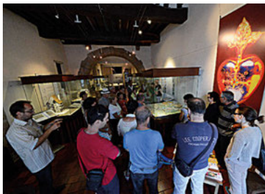
Visite du CIAP

Du mardi au samedi de 10h à 12h et de 14h à 18h, ouverture le dimanche de 15h à 18h à partir du 21 mai