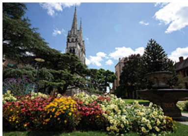
Jardin haut (place Laussedat)