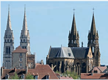
La cathédrale, la Mal Coiffée et le Sacré-Cœur