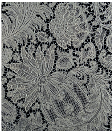
Décor naturaliste, volant Régence, 1715-1723, Flandres

Grâce à des plans-reliefs et des maquettes, le CIAP retrace l'évolution de la ville. Des audio guides rendent la visite accessible à tous, une borne numérique permettra aux adultes et aux enfants d'avoir accès à des documents anciens, des jeux, des ouvrages pour découvrir en s'amusant le patrimoine moulinois.