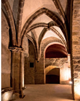
Les caves Bertine