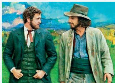
Cézanne et moi