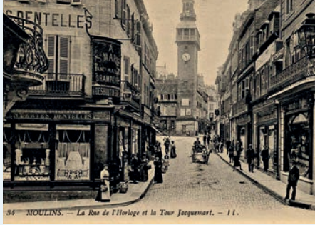
Moulins à l'époque de Gabrielle Chanel