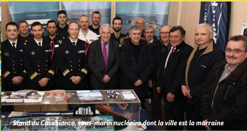
Stand du Casabianca, sous-marin nucléaire dont la ville est la marraine