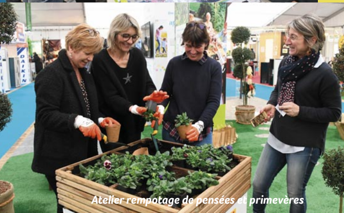
Atelier repotage de pensées et primevères

Excellent cru 2020 pour la Foire de Moulines avec Tahiti invitée d'honneur. Vous avez été des milliers, du bassin moulinois mais aussi des départements voisins, à vous rendre sur la première foire commerciale de l'année. La ville de Moulines, sur son stand "une ville à la campagne", vous a initiés au repotage et vous a prodigués tous les conseils nécessaires pour égayer nos espaces verts, qu'ils soient privés ou publics. Un grand merci à tous pour votre bonne humeur et votre participation. Les Moulineois ont la main verte !