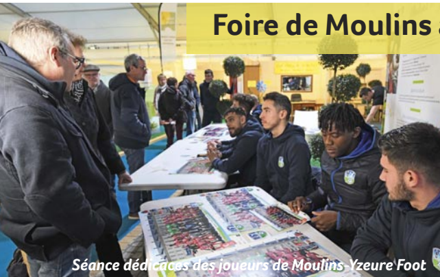
Séance de dédicaces des joueurs de Moulines-Yzeure Foot

Excellent cru 2020 pour la Foire de Moulines avec Tahiti invitée d'honneur. Vous avez été des milliers, du bassin moulinois mais aussi des départements voisins, à vous rendre sur la première foire commerciale de l'année. La ville de Moulines, sur son stand "une ville à la campagne", vous a initiés au repotage et vous a prodigués tous les conseils nécessaires pour égayer nos espaces verts, qu'ils soient privés ou publics. Un grand merci à tous pour votre bonne humeur et votre participation. Les Moulineois ont la main verte !