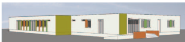
La Maison des Associations avant/après travaux (projet).