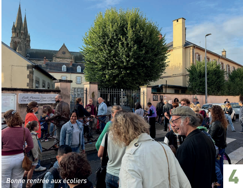
Bonne rentrée aux écoliers