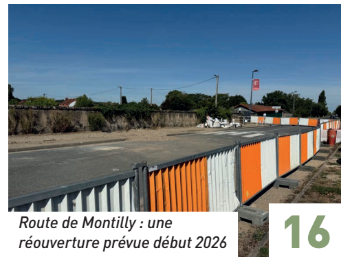
Route de Montilly : une réouverture prévue début 2026