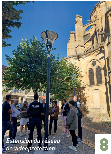
Extension du réseau de vidéoprotection