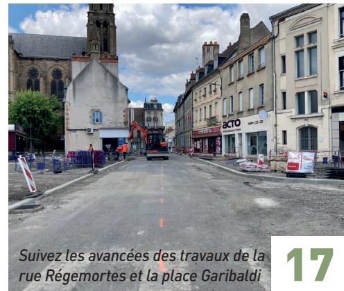
Suivez les avancées des travaux de la rue Régemortes et la place Garibaldi