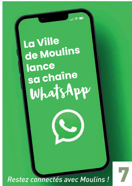
Restez connectés avec Moulins !