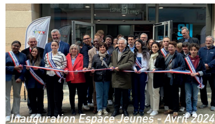
Inauguration Espace Jeunes - Avril 2024