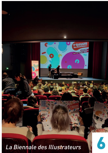
La Biennale des Illustrateurs