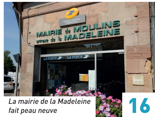
La mairie de la Madeleine fait peau neuve