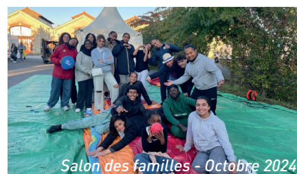
Salon des familles - Octobre 2024