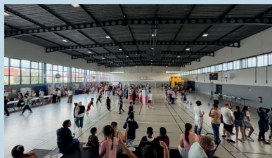
Moulins Game's Day - Septembre 2024