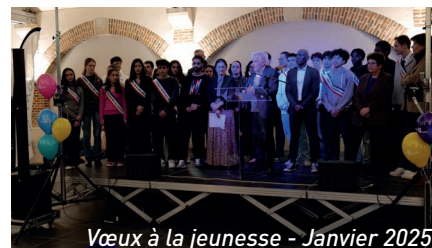
Vœux à la jeunesse - Janvier 2025