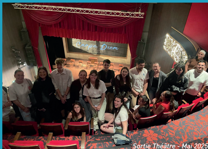
Sortie Théâtre - Mai 2025