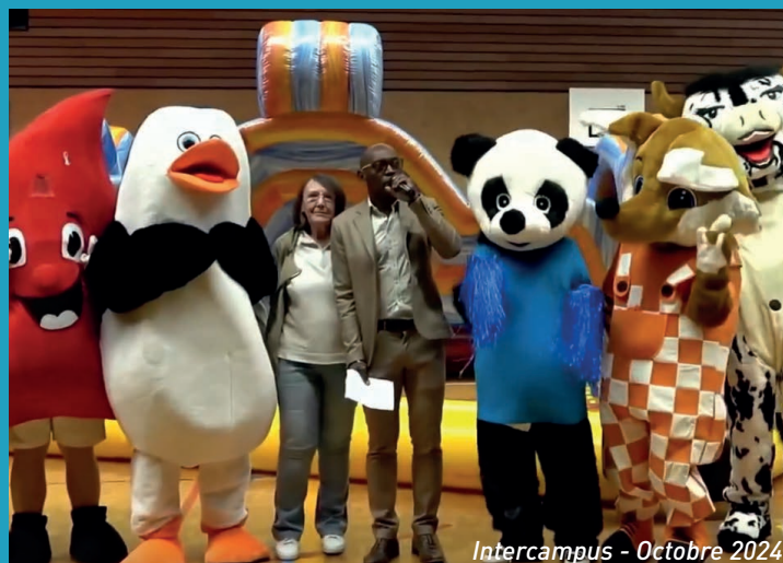
Intercampus - Octobre 2024