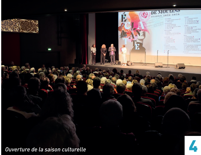
Ouverture de la saison culturelle