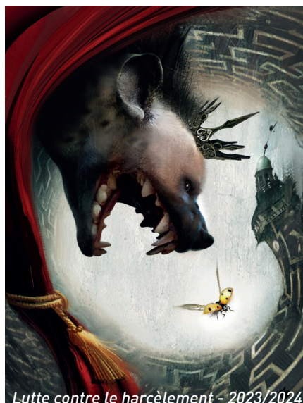
Lutte contre le harcèlement - 2023/2024

L'événement phare de ce mandat est la création de la soirée des vœux à la jeunesse. La première édition a eu lieu le 31 janvier 2025.