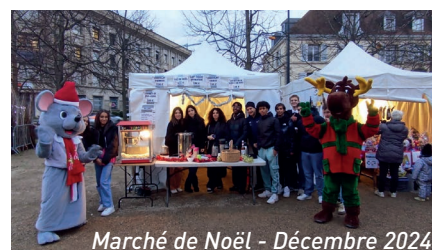
Marché de Noël - Décembre 2024