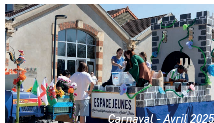
Carnaval - Avril 2025