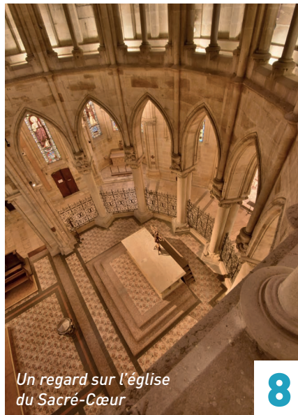
Un regard sur l'église du Sacré-Cœur