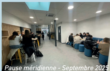
Pause méridienne - Septembre 2025

Tous les midis, les jeunes peuvent se retrouver à l'Espace Jeunes : un espace convivial où sont mis à disposition micro-ondes, vaisselle et boissons chaudes. La fréquentation est passée d'une vingtaine de jeunes en 2023-2024 à plus d'une trentaine en 2024-2025, pour atteindre 46 inscrits lors de cette rentrée scolaire 2025-2026. Les familles saluent ce dispositif simple et efficace.