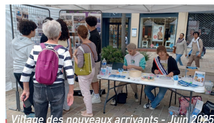
Village des nouveaux arrivants - Juin 2025