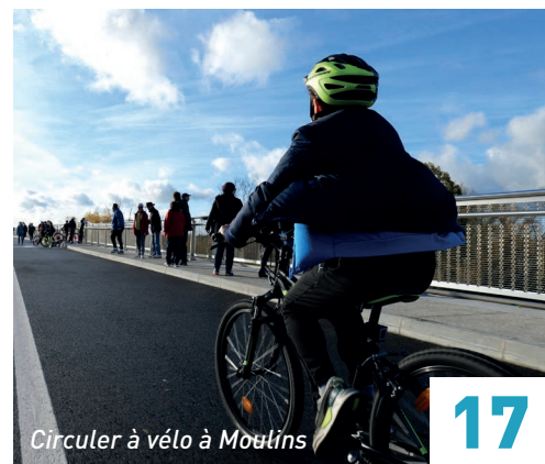
Circuler à vélo à Moulins