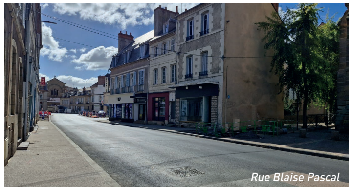
Rue Blaise Pascal

Enfin, la gestion de l'eau et du climat a été pleinement intégrée au projet. Plus de 1 890 m 2 de surfaces d'infiltration permettront de mieux absorber les pluies, tandis que les revêtements clairs, associés aux plantations, contribueront à réduire les effets du réchauffement climatique.