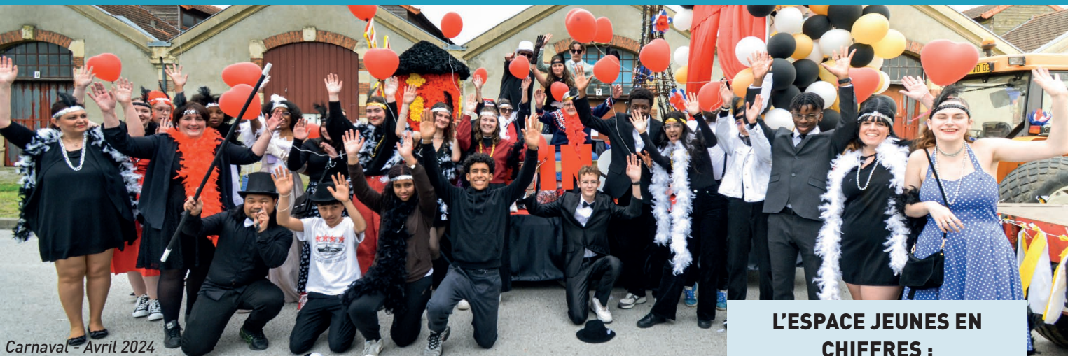
Carnaval - Avril 2024