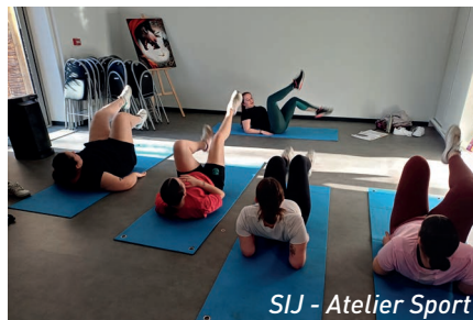
SIJ - Atelier Sport

La dimension sociale est également forte : 40 dossiers d'aide alimentaire pour les étudiants ont été traités en 2023-2024, 52 en 2024-2025, en partenariat avec le Secours Populaire, la Croix Rouge et l'épicerie solidaire Episol . Un dispositif "Freego" permet également d'apporter une aide ponctuelle à tous les jeunes, qu'ils soient étudiants ou non.