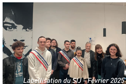
Labellisation du SIJ - Février 2025

De septembre à décembre 2023, la SIJ avait reçu 338 personnes . En 2024, ce sont 2 508 jeunes qui ont bénéficié d'un accueil individuel ou collectif . La majorité étaient étudiants (42,6 %) ou